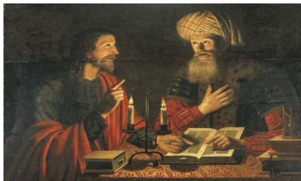
«Ночной разговор Иисуса и Никодима». Картина Крейна Хендрикса

Утрата единства сего породила стремление людей вернуть его, с тем — и науку исканий, л ин гвистику. Сильной стать ей — есть родиться в|го|рич но: от Слова, Начала. Лингвистика Мира — сакральная, труд мой, — наука земная, рожденная св ы ше. То — Зн ан ье, ст я жавшее Силу: Ум — Сердце, Ист ок . Им сильны, обретем мы Себ я .