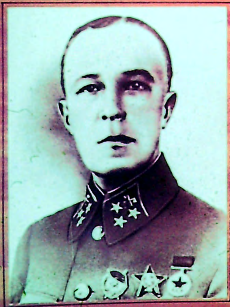
Генерал Дмитрий Михайлович Карбышев.