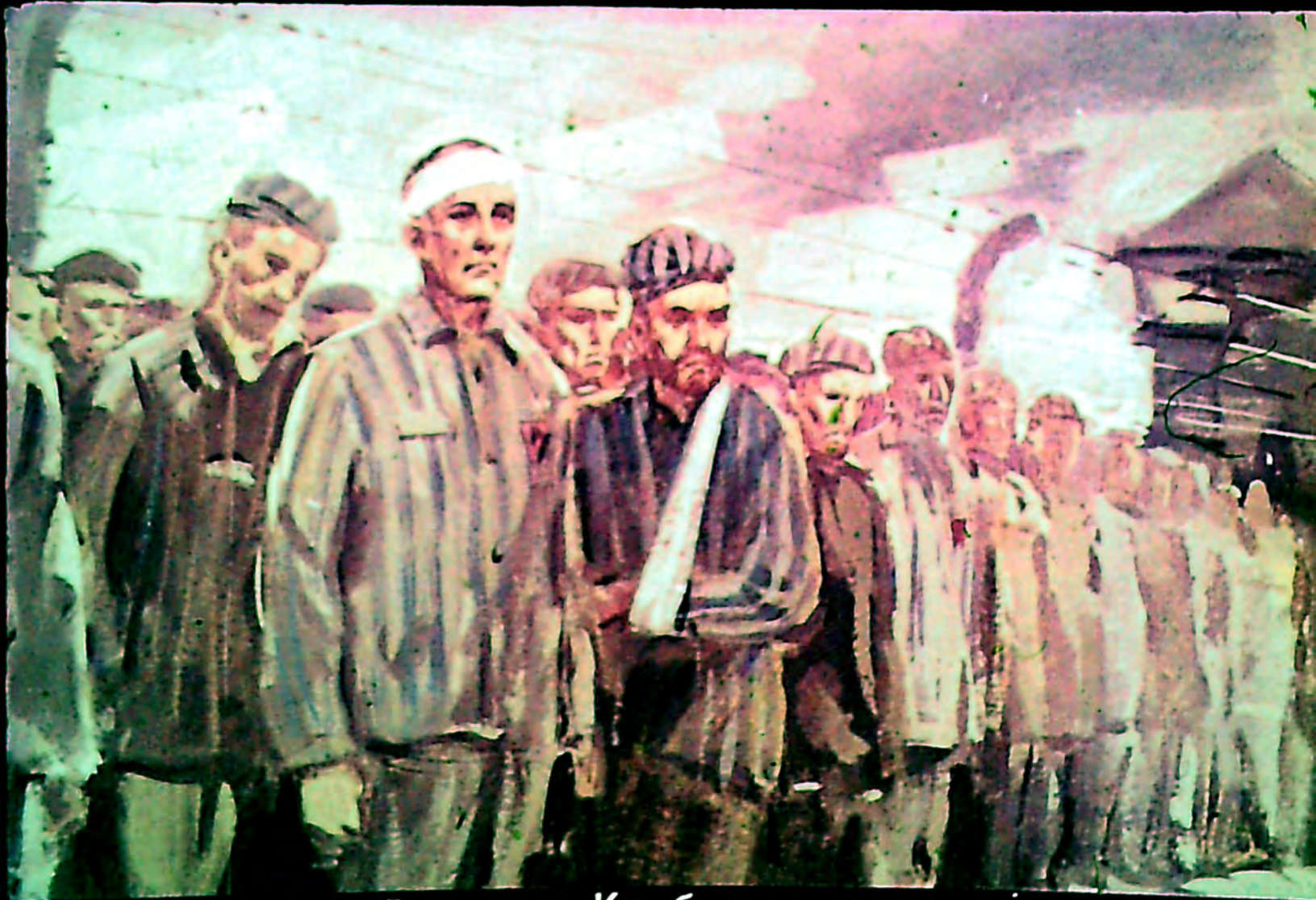
Тяжело раненный генерал Карбышев попал в плен и оказался в гитлеровском концентрационном лагере.