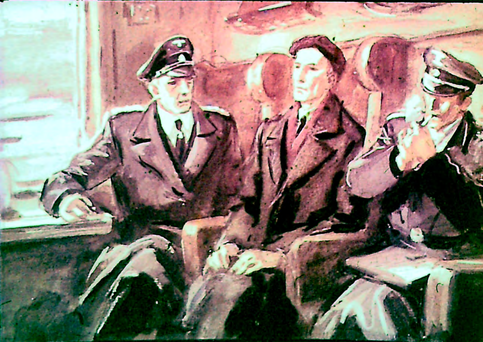
Гестаповцы повезли генерала в Берлин.