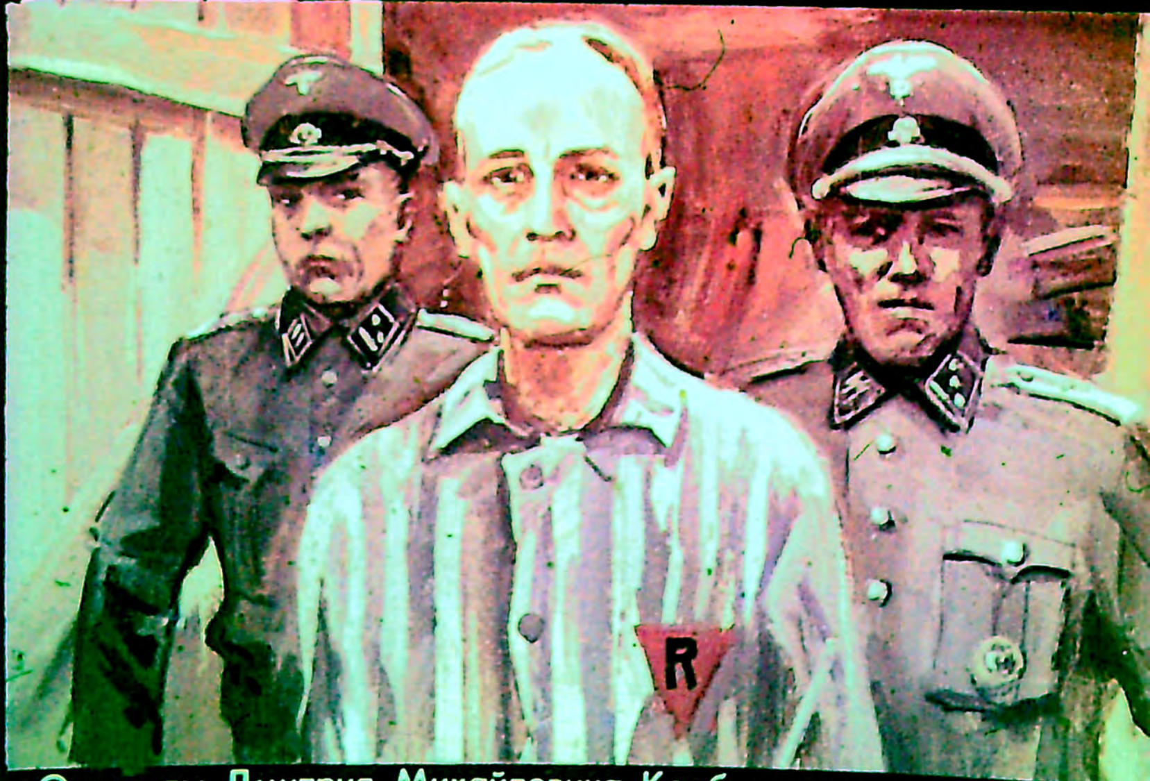
Однажды Дмитрия Михайловича Карбышева вызвали к ко- менданту лагеря.