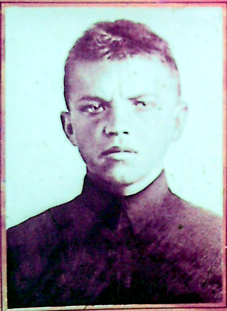
Рядовой Александр Матросов.