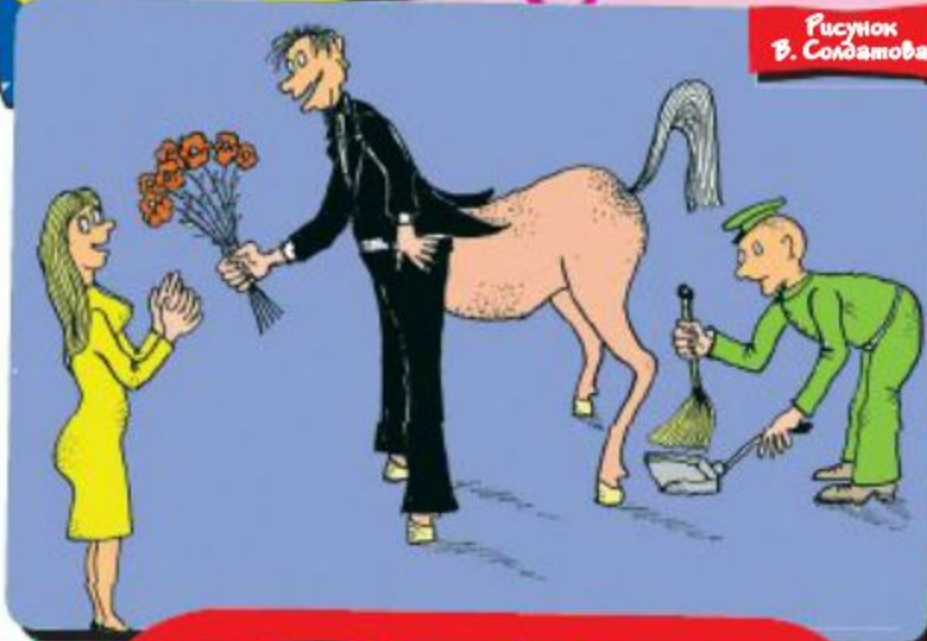
Рисунок В. Солдатов