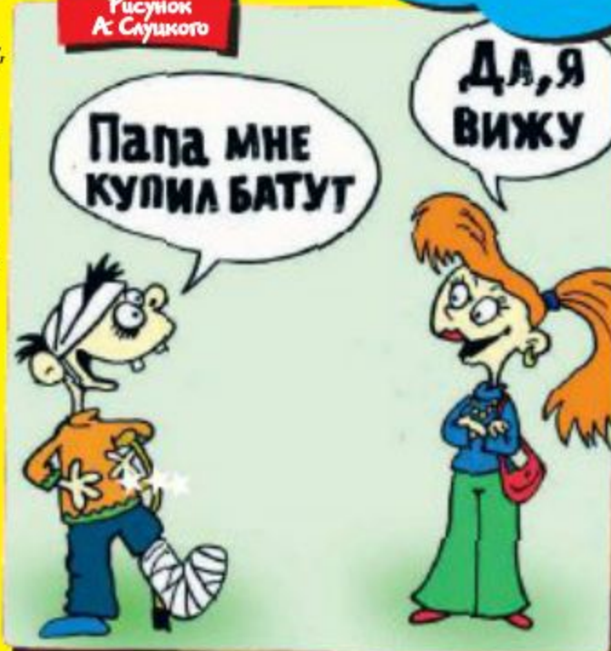
Рисунок А. Слуцкого

лась... И тут она хлопает себя по лбу: — Я же окна не закрыла!