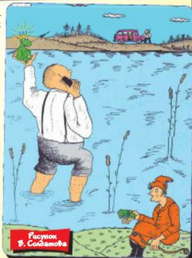
Рисунок В. Солдатов