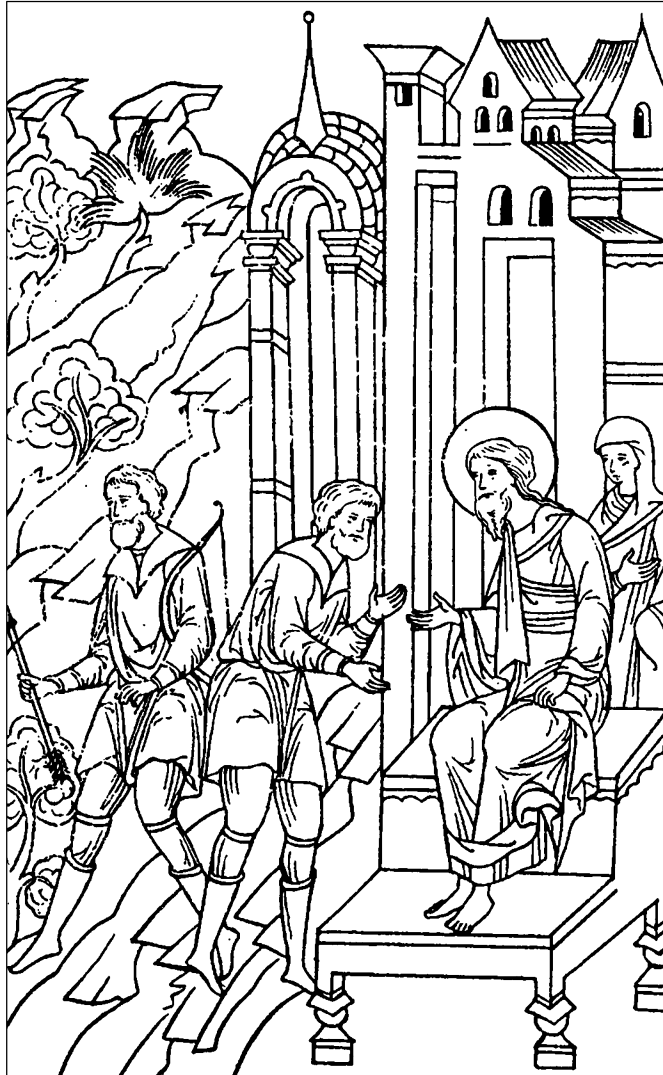
Исаак отправляет Исава на охоту