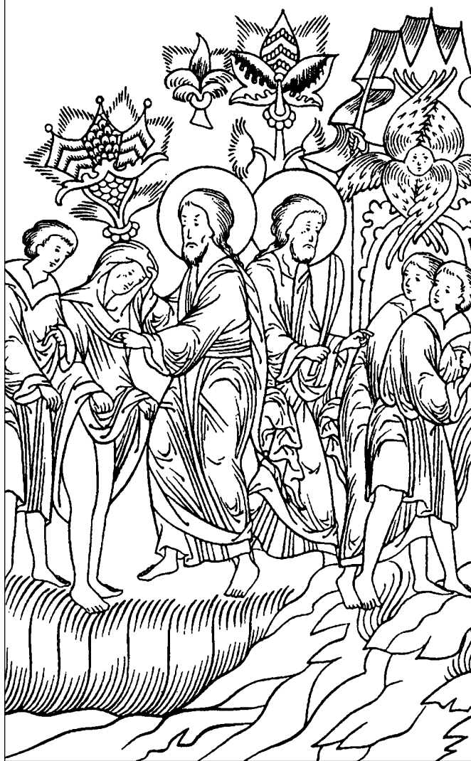
Изгнание из рая