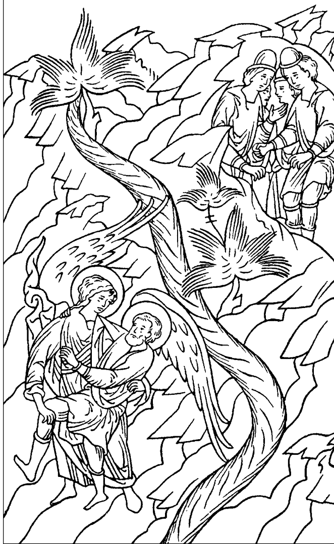
Иаков борется с Ангелом