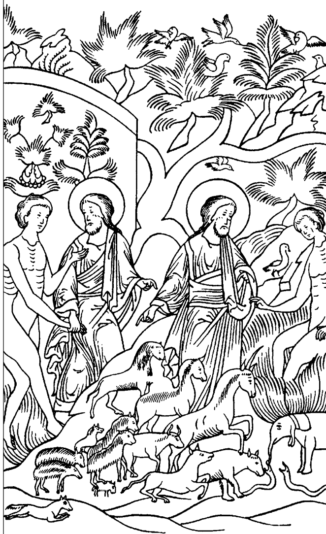
Адам дает имена животным