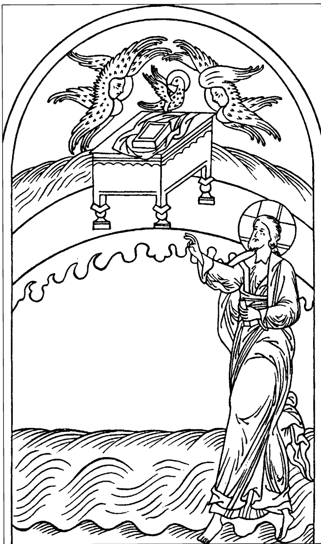
Сотворение неба и земли