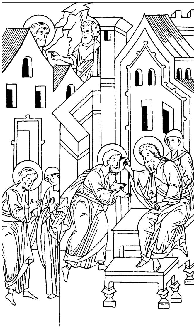
Исаак благословляет Иакова