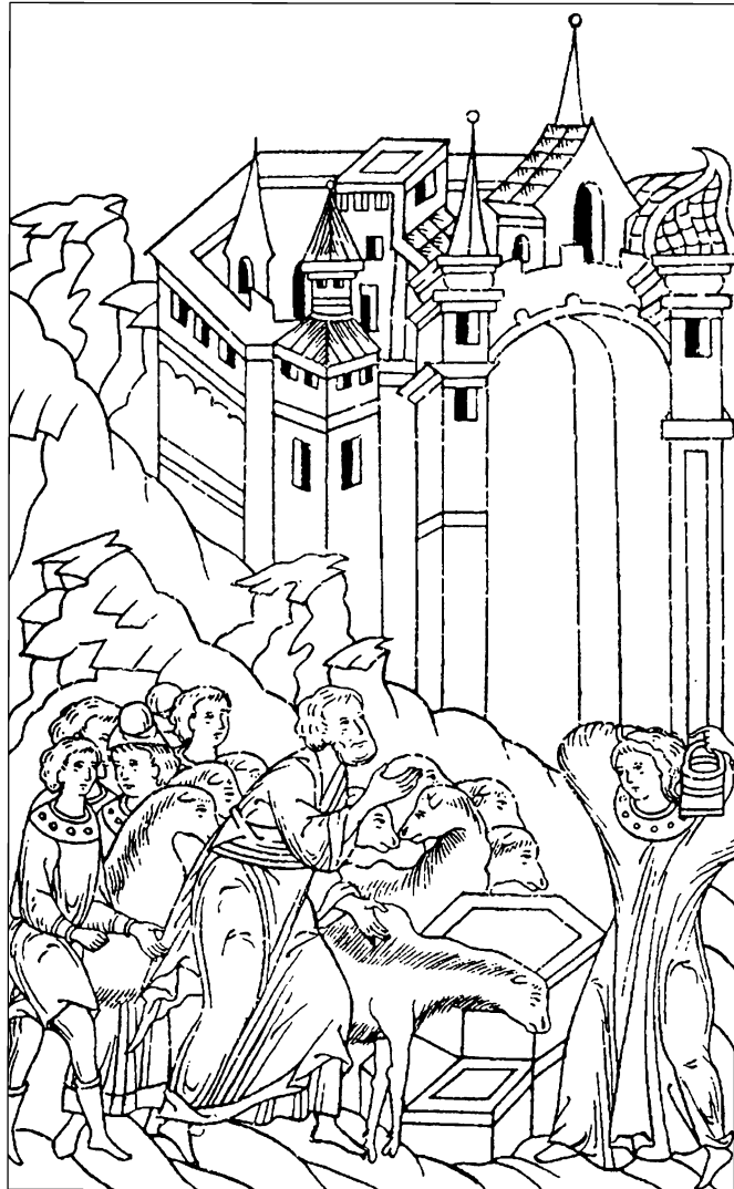
Встреча раба Авраамова с Ревеккой