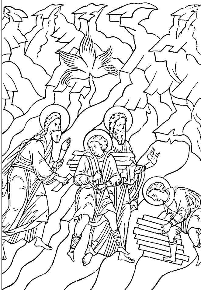
Авраам поднимается с Исааком на гору