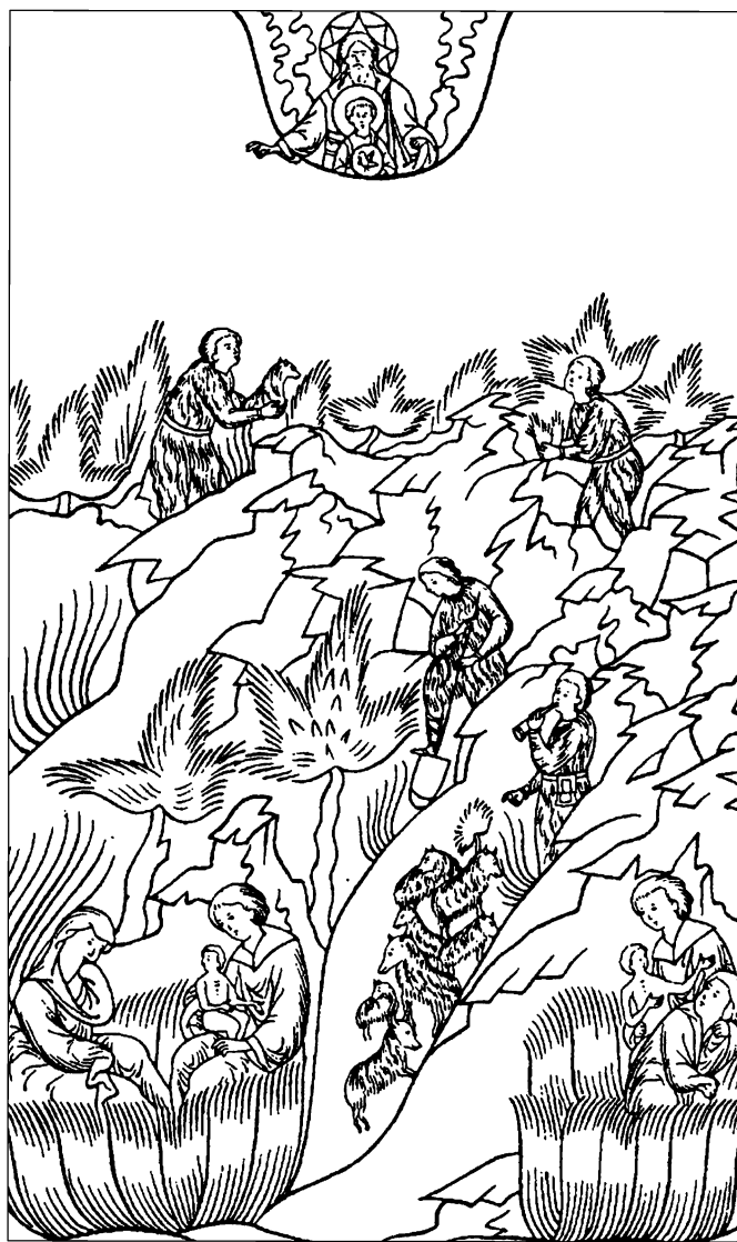
Каин и Авель