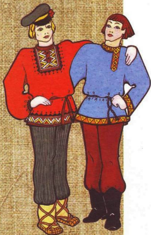
Рубаха и порты