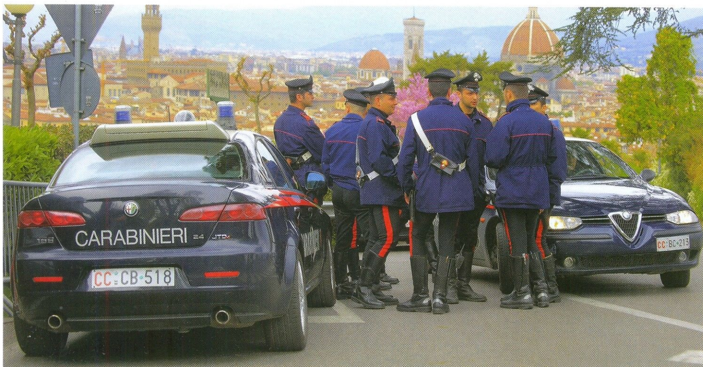
АВТОМОБИЛИ ALFA ROMEO И СЕГОДНЯ ОСТАЮТСЯ НА ВООРУЖЕНИИ КОРПУСА КАРАБИНЕРОВ

лами Италии, а в случае необходимости могут использоваться и в силовых действиях на территории своей страны.