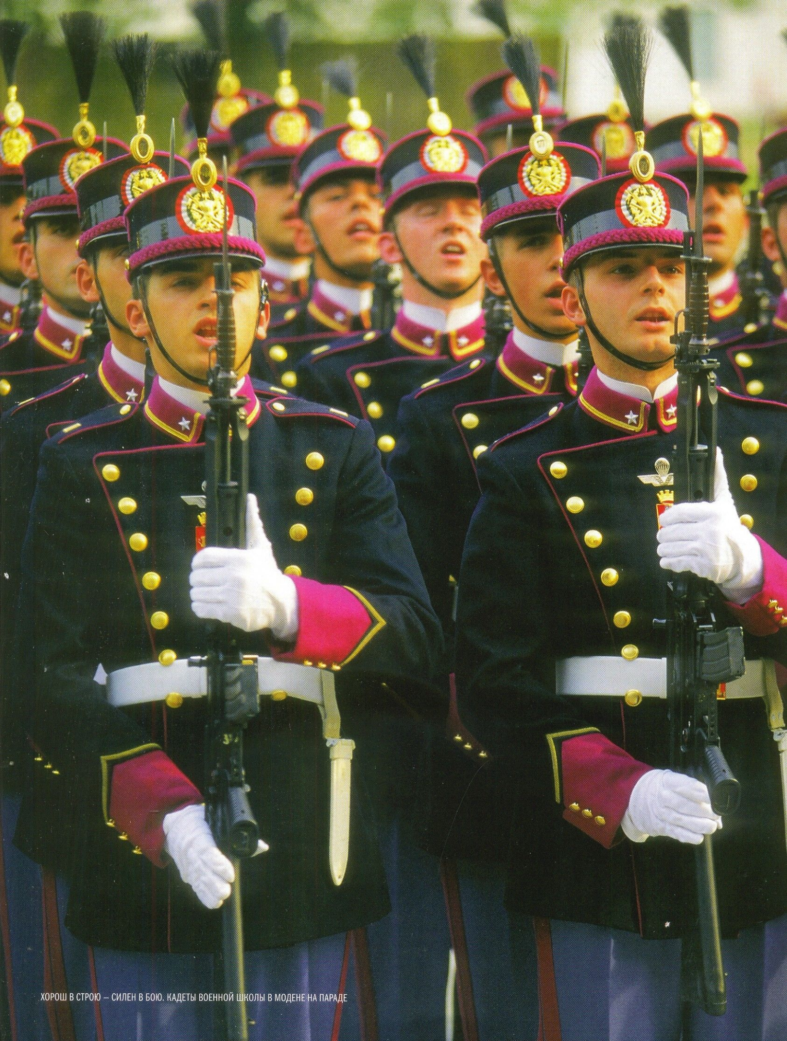
ХОРОШ В СТРОЮ — СИЛЕН В БОЮ. КАДЕТЫ ВОЕННОЙ ШКОЛЫ В МОДЕНЕ НА ПАРАДЕ