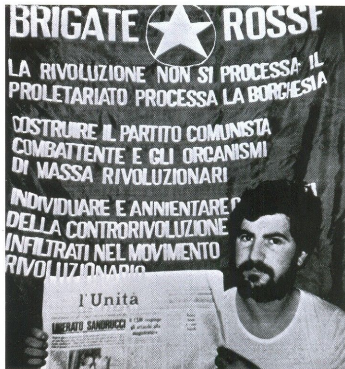
РОБЕРТО ПЕЧИ — ОДИН ИЗ ЛИДЕРОВ «КРАСНЫХ БРИГАД»

вынудить правительство пойти на переговоры и признать организацию «полноценным политическим оппонентом». На сей раз власти на компромисс не пошли, и после 55 дней заточения Моро был расстрелян. Его труп нашли в машине в самом центре Рима. В 1979 году террористы совершили 2150 нападений. Их атакам подвергались учебные заведения, профсоюзы, офисы политических партий, казармы карабинеров и полицейские участки. Правоохранительные органы Италии объявили настоящую охоту на членов «Красных бригад». Считается, что в начале 80-х годов организацию удалось почти полностью ликвидировать. На протяжении нескольких недель были арестованы более 300 террористов, разгромлены отделения «Красных бригад» в Турине, Милане, Риме и Венеции. К 1983 году была арестована почти тысяча человек, подозреваемых в связях с бригадами. Следствие и суды продолжались с 1982 по 1996 год. В итоге 32 главных преступника были осуждены на пожизненное заключение, остальные получили в совокупности несколько сотен лет тюрьмы.