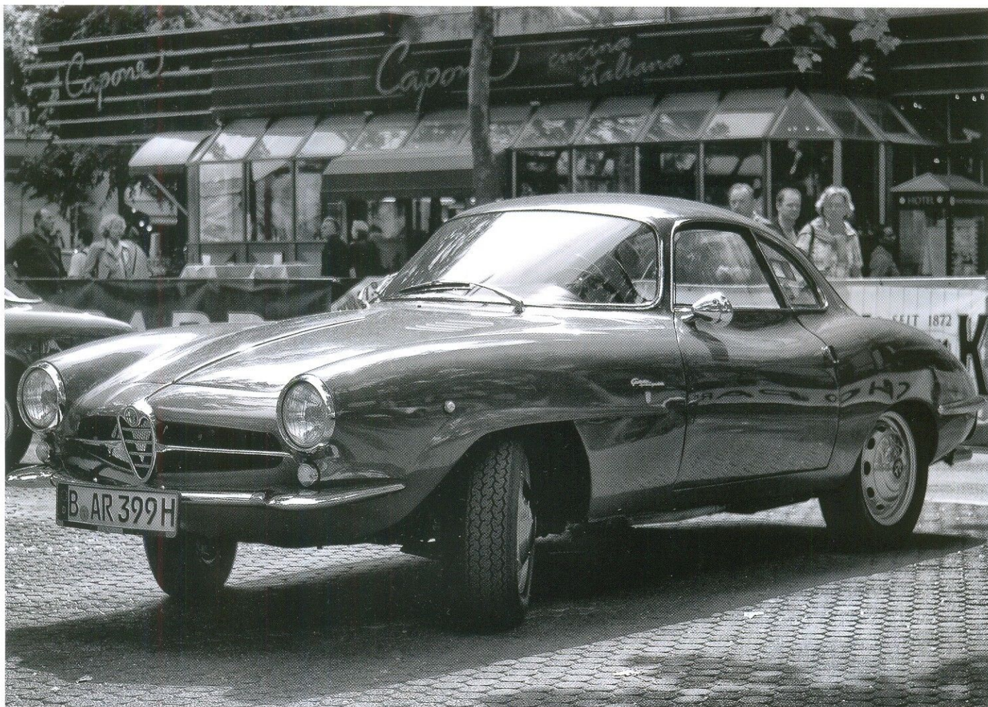
ALFA ROMEO GIULIETTA SS НА ВЫСТАВКЕ, ПОСВЯЩЕННОЙ 125-ЛЕТИЮ АВТОМОБИЛЯ (БЕРЛИН, 2011 ГОД)

Дизайнеры Bertone трудились не зря: стильная новинка обратила на себя внимание покупателей, прежде всего тех, кто хотел почувствовать себя автогонщиком. Именно на таких клиентов был рассчитан низкий кузов, 4-цилиндровый 80-сильный мотор, выходивший на максимальную мощность при 6300 об/мин, механическая 5-ступенчатая коробка передач. Хорошая управляемость и маневренность подтверждали спортивный характер автомобиля, а его максимальная скорость — 165 км/ч — могла удовлетворить самых амбициозных автолюбителей, особенно если учесть, что в то время дороги в Европе были далеки от совершенства. Правда, не обошлось и без ложки дегтя: все колеса были оснащены довольно консервативными барабанными тормозами.