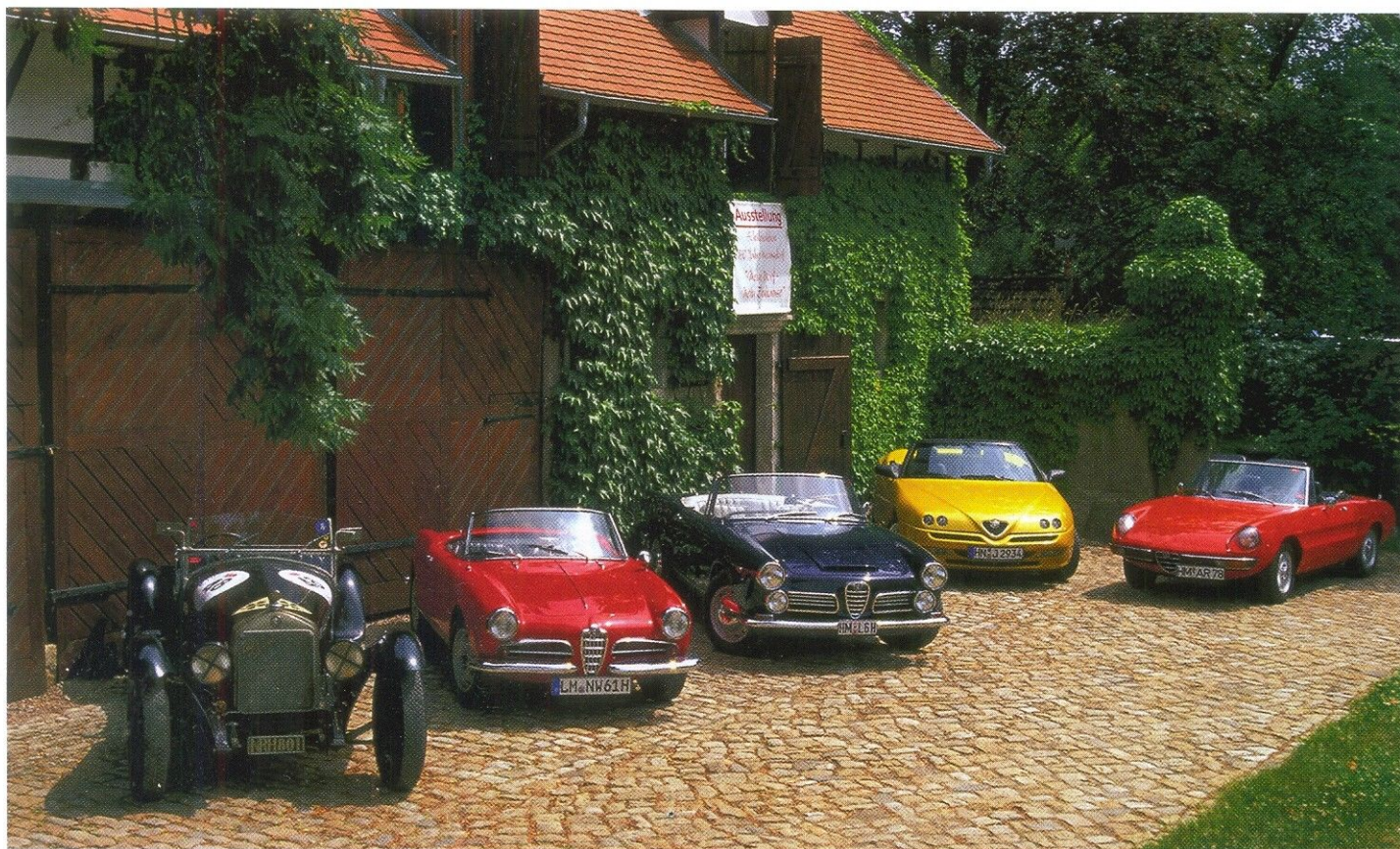
6C ZAGATO 1930 И GIULIETTA РАЗЛИЧНЫХ МОДИФИКАЦИЙ НА 90-ЛЕТНЕМ ЮБИЛЕЕ ALFA ROMEO

Позднее появилась еще одна версия седана — Turismo Internazionale — и два двухместных кабриолета: Spider и Spider Veloce с кузовами от ателье Pininfarina, а затем Sprint Speciale со 114-сильным двигателем, разработанный Bertone.