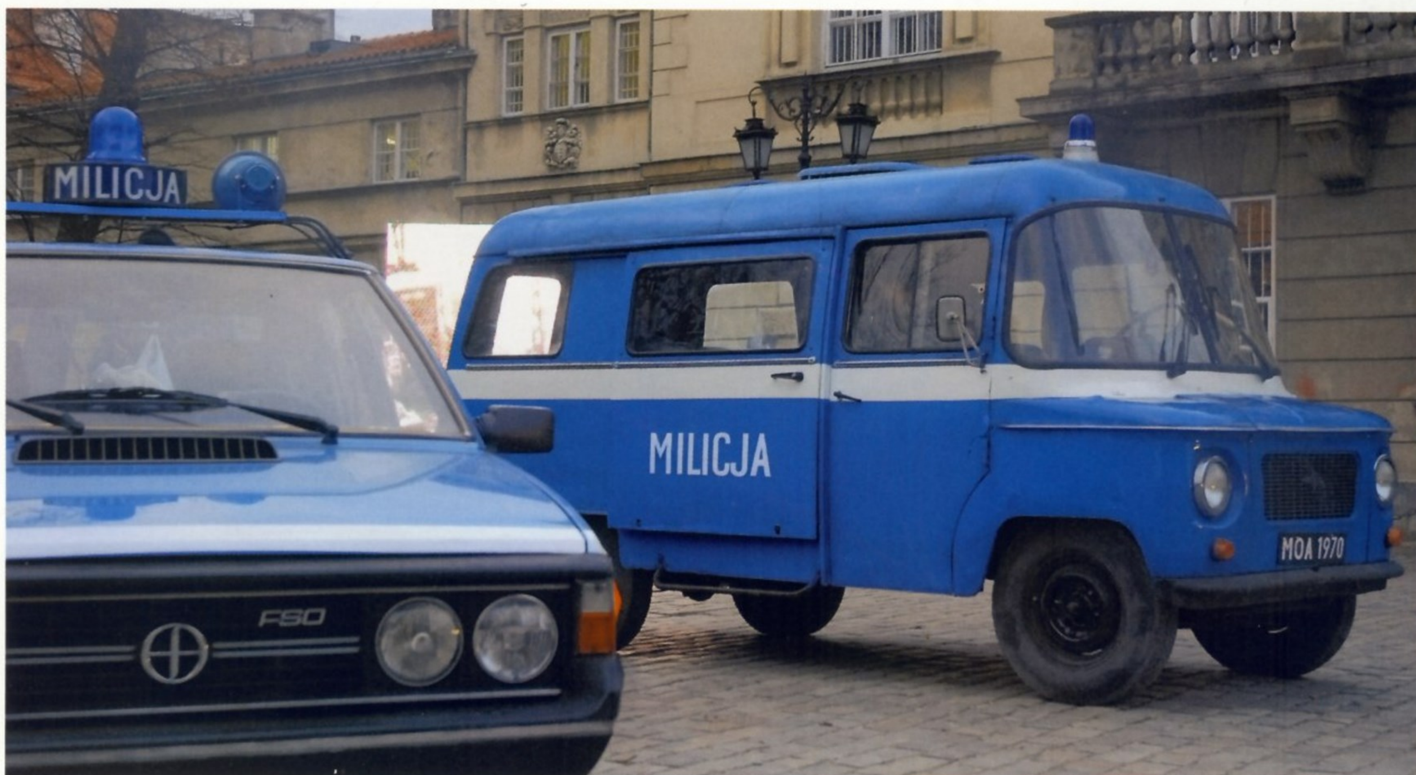
ЭТИ АВТОМОБИЛИ КОГДА-ТО СОСТОЯЛИ НА СЛУЖБЕ В НАРОДНОЙ МИЛИЦИИ ПНР

в полицейской типографии. Несколько позже были созданы Центральная лаборатория государственной полиции, Управление по борьбе с изготовлением фальшивых денег и Управление по борьбе с нелегальным оборотом наркотиков.