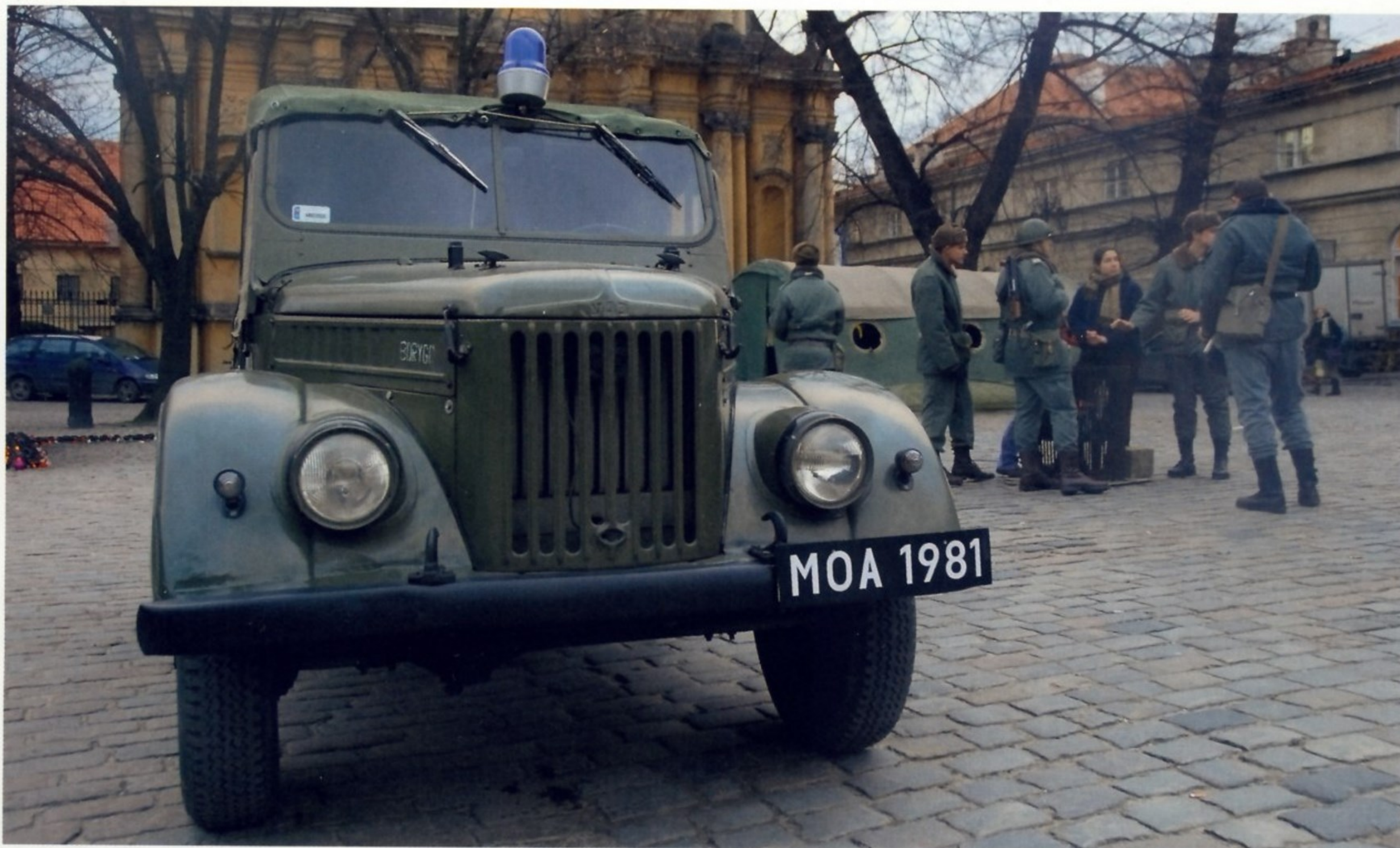
ИСТОРИЧЕСКИЙ ПАРАД В ВАРШАВЕ (ДЕКАБРЬ 2005 ГОДА)

На протяжении своей истории польское государство не раз меняло статус: земли Польши завоевывались, делились между соседями, объединялись, и страна вновь обретала свою государственность. Еще в Средние века в польском «госаппарате» были чиновники, отвечавшие за соблюдение законов и поддержание порядка в городах и селах — наместники, каштеляны и юстициариусы. Примерно в XIII веке полицейские функции