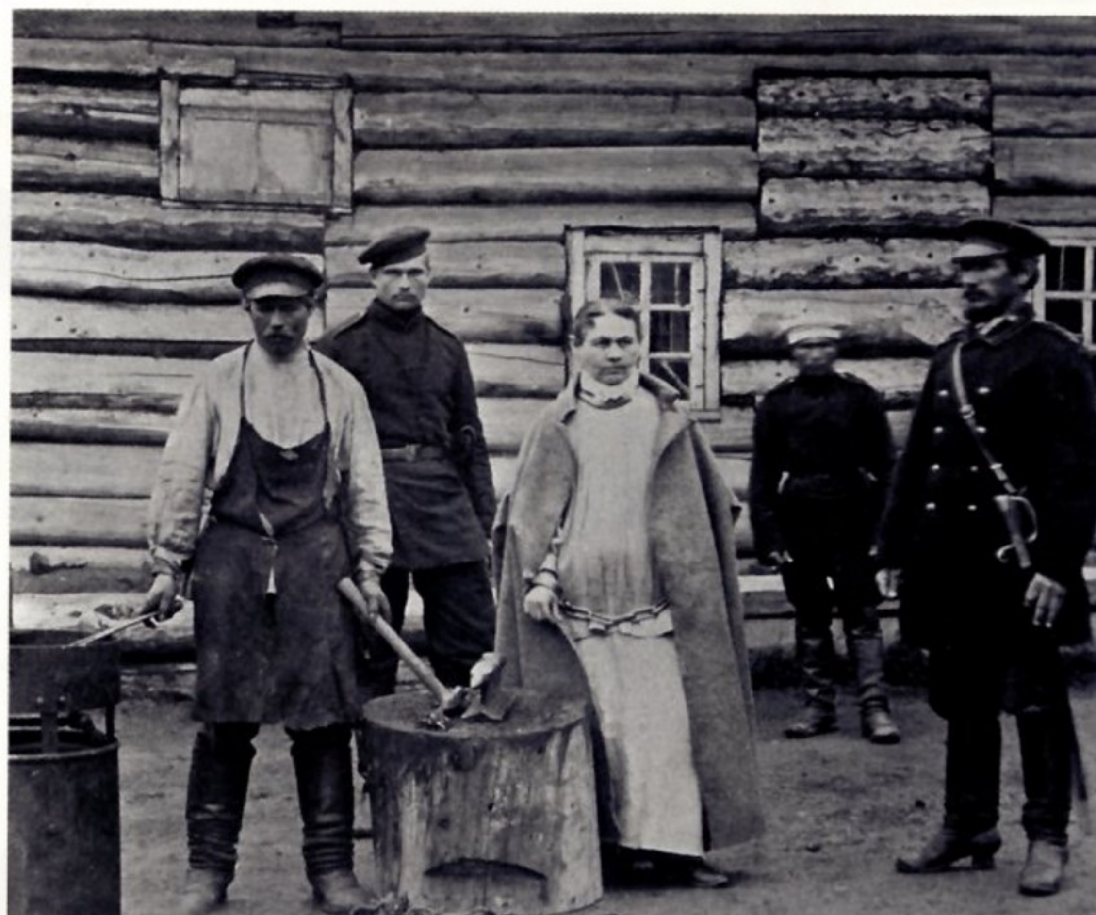
СОФЬЮ БЛЮВШТЕЙН ЗАКОВЫВАЮТ В КАНДАЛЫ

Однако ни через час, ни через два дама не вернулась. Вызвали полицию. Тогда-то и выяснилось, что это мошенничество,