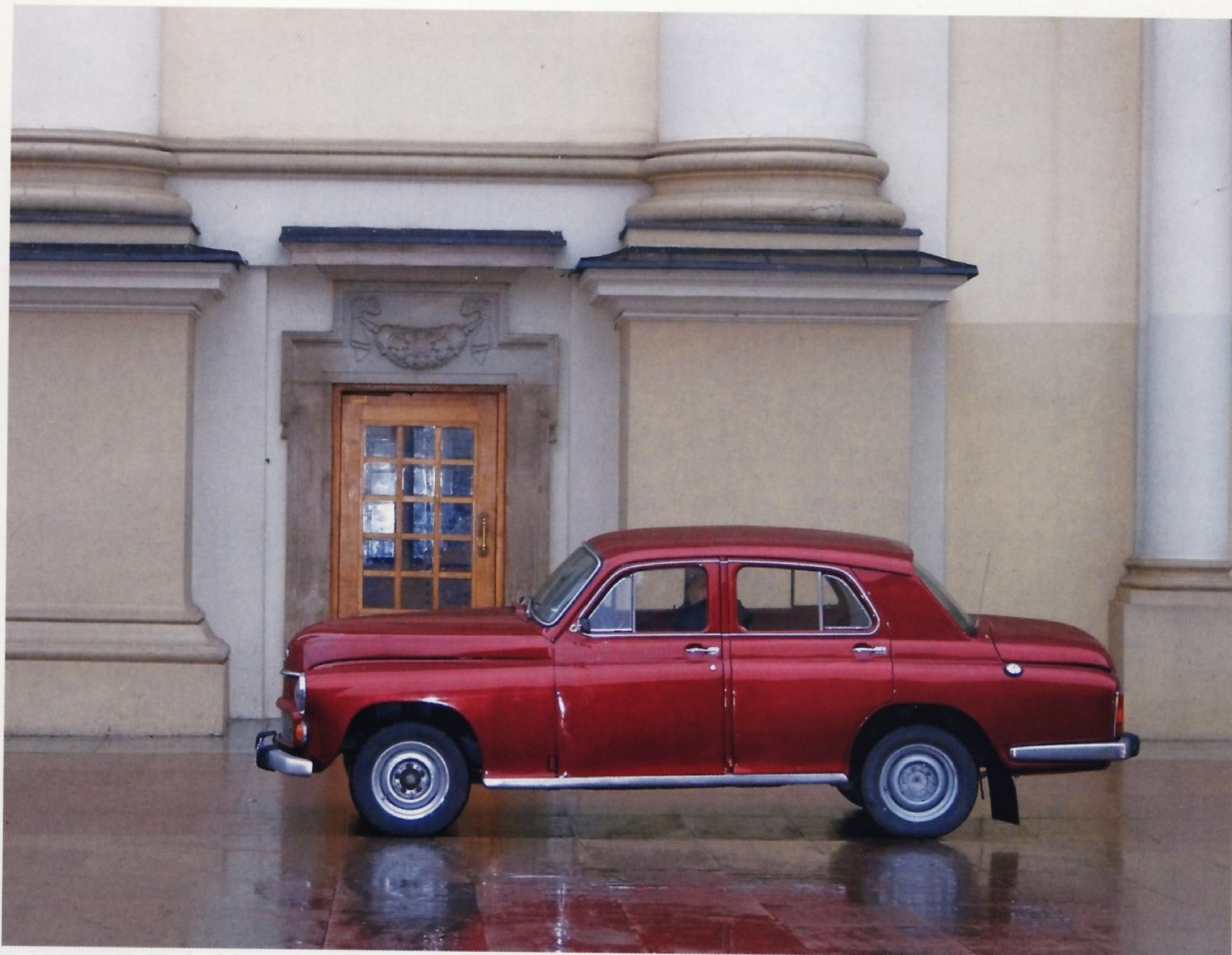
ВИНТАЖНОЕ АВТО ОТЛИЧНО ВПИСЫВАЕТСЯ В ОБЩИЙ СТИЛЬ ИСТОРИЧЕСКОГО ЦЕНТРА ПОЛЬСКОЙ СТОЛИЦЫ

Автомобиль выпускался с несколькими вариантами кузова — седан (223), универсал (223К), пикап (224Р). Существовала и медицинская версия (223А). Самым распространенным был, разумеется, седан, на втором месте шел универсал. Оба автомобиля оснащались одним и тем же 70-сильным мотором, но универсал был немного длиннее, шире и тяжелее, что сказывалось на его динамических характеристиках. Так, максимальная скорость седана составляла 130 км/ч, а универсала — 126 км/ч. Зато такой кузов был более утилитарным и позволял перевозить не только пассажиров, но и грузы. Обе версии поставлялись и в автопарки Народной милиции Польши.