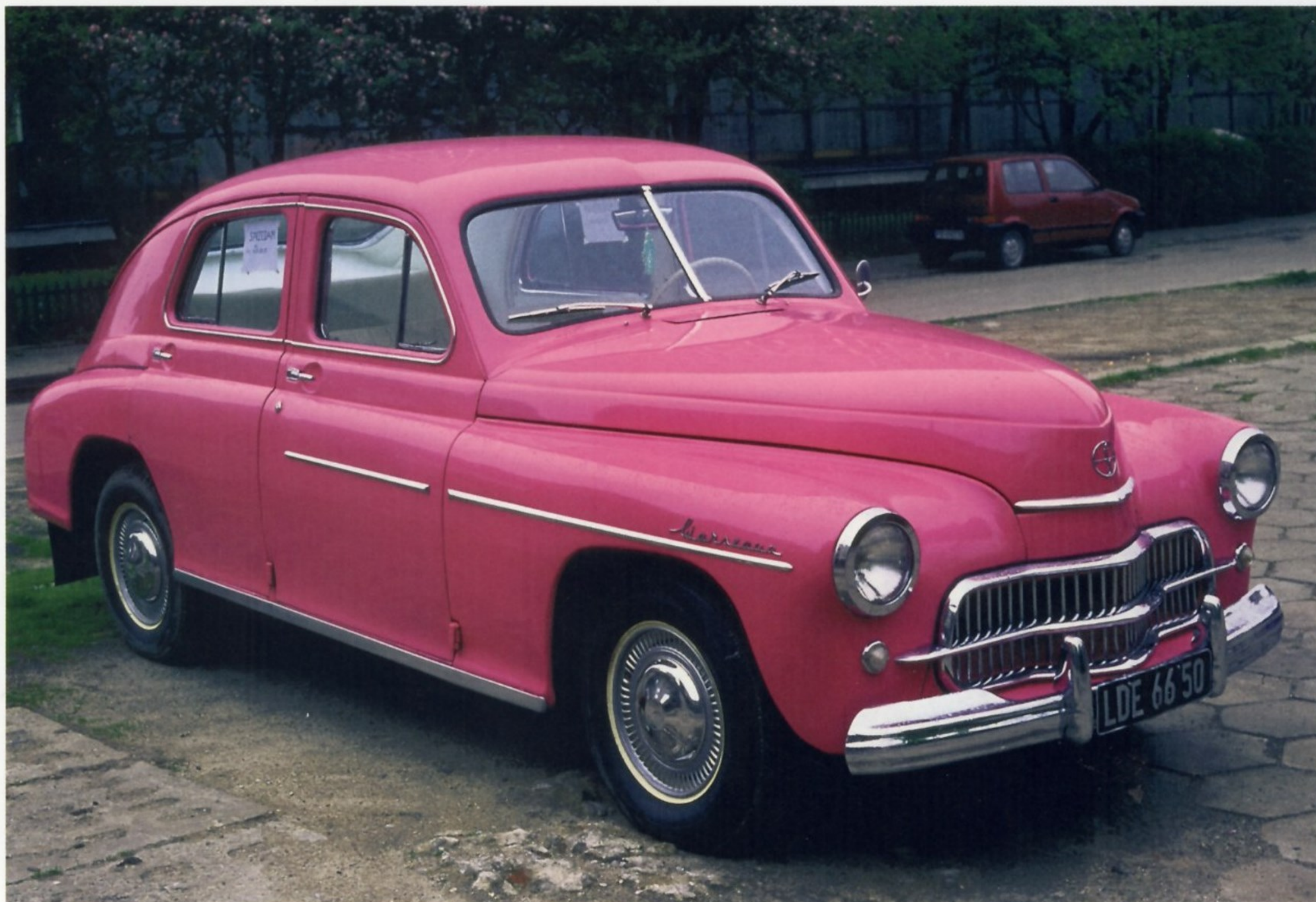
WARSZAWA СТАЛА ПЕРВЫМ ПОСЛЕВОЕННЫМ ПОЛЬСКИМ АВТОМОБИЛЕМ

Как известно, «Победа» была не самым удобным, дешевым и технологичным автомобилем своего времени, поэтому польские специалисты занялись ее модернизацией. Для начала конструкторы FSO взяли за двигатель и серьезно его усовершенствовали. Мощность 50-сильного мотора «Победы» была доведена сначала до 57, а потом и до 70 л.с. Нижнеклапанный двигатель переработали в верхнеклапанный. Модернизировали коробку передач, сделав ее четырехступенчатой. Преобразился и кузов: вместо «понтон» появился обычный седан с длинным багажником. Новинка была представлена публике в 1964 году под маркой Warszawa 203. По европейской классификации автомобиль относился к категории среднеразмерных седанов.