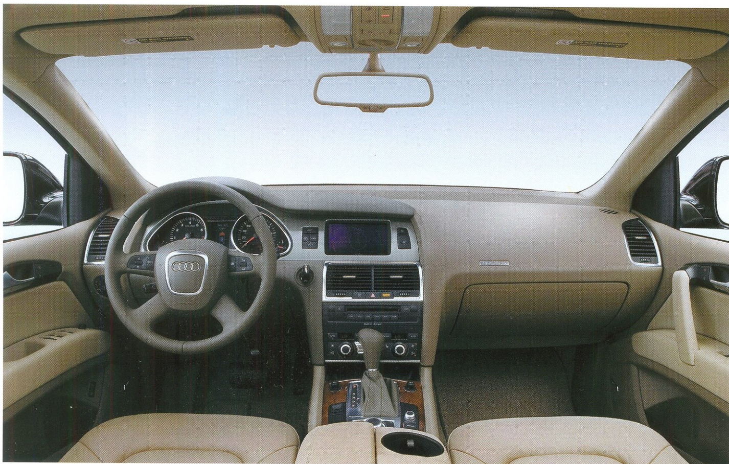
ИНТЕРЬЕР ВОДИТЕЛЬСКОГО МЕСТА ВЫВЕРЕН ДО МЕЛОЧЕЙ. ЗДЕСЬ ВСЕ ГАРМОНИЧНО, СТРОГО И РАЦИОНАЛЬНО

не самые выдающиеся. Но надо учитывать и тот факт, что автомобиль весил около 2600 кг, а с пассажирами на борту и того больше.