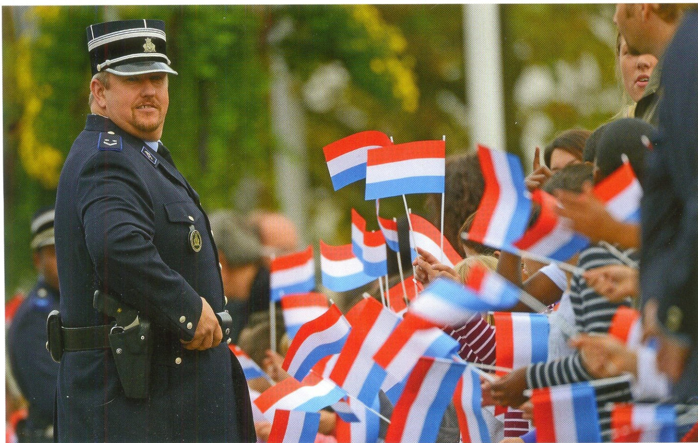
ПОЛИЦЕЙСКИЙ НА УЛИЦЕ ЛЮКСЕМБУРГА ВО ВРЕМЯ ЦЕРЕМОНИИ БРАКОСОЧЕТАНИЯ НАСЛЕДНИКА ПРЕСТОЛА ПРИНЦА ГИЙОМА

по борьбе с организованной преступностью, финансовыми и экономическими правонарушениями, отдел по защите прав несовершеннолетних и аналитический отдел.