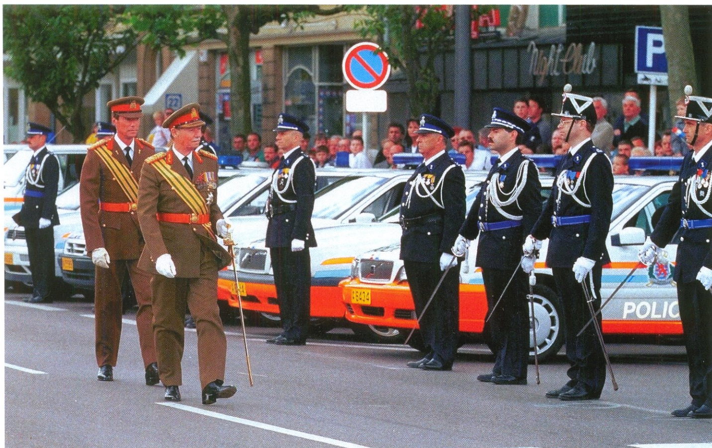
ВЕЛИКИЙ ГЕРЦОГ ЛЮКСЕМБУРГА ОДНОВРЕМЕННО ЯВЛЯЕТСЯ И ГЛАВОЙ НАЦИОНАЛЬНОЙ ПОЛИЦИИ

До недавнего времени в Люксембурге существовала и третья силовая структура — жандармерия, в состав которой входило около 800 человек, однако в январе 2000 года ее объединили с полицейским ведомством. С тех пор закон и порядок в стране поддерживает Национальная полиция Великого Герцогства — Police Grand-Ducal. В ее структуру входят генеральный директорат, центральные и региональные отделы. Управление и контроль за деятельностью полиции находятся в руках Министерства юстиции. Главный орган полиции Люксембурга — генеральный директорат. Он делится на пять отделов.