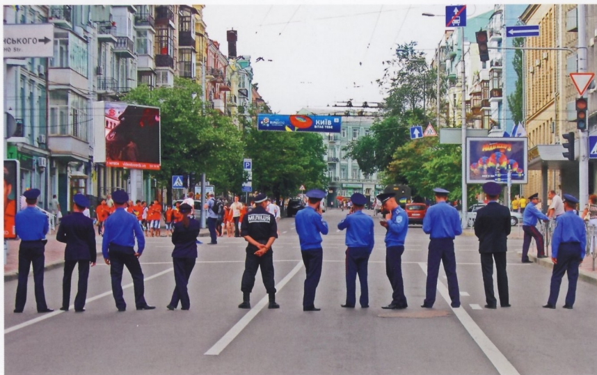
МИЛИЦЕЙСКИЙ КОРДОН НА УЛИЦЕ КИЕВА ПЕРЕД МАТЧЕМ АНГЛИЯ-ШВЕЦИЯ (15 ИЮНЯ 2012 ГОДА)

автомобильная инспекция. Она же ведет статистику дорожно-транспортных происшествий и занимается розыском угнанных автомобилей.