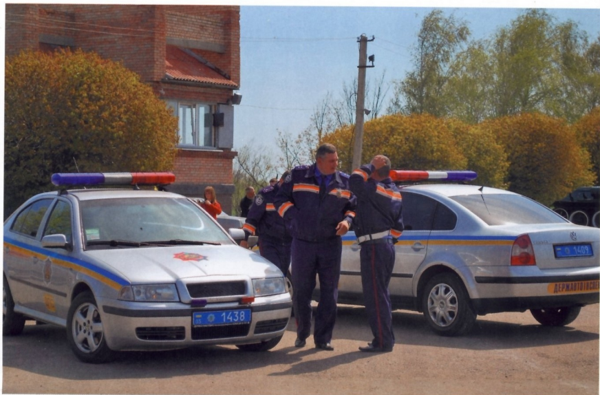
ИНСПЕКТОРЫ ДПС (УКРАИНА)

Свое название правоохранительные органы Украины сохранили еще с советских времен. После распада Советского Союза в декабре 1991 года Украина стала независимым государством. Среди многочисленных новых законодательных актов был принят и Закон о милиции. Согласно этому документу, милиция является государственным вооруженным органом исполнительной власти Украины, задача которого — защита жизни, здоровья, прав, свобод и собственности граждан, защита интересов общества и государства от противоправных действий, сохранность природной среды. Структурно украинская милиция делится на уголовную, милицию общественной безопасности, транспортную милицию, Государственную автомобильную инспекцию, милицию охраны и специальную милицию.