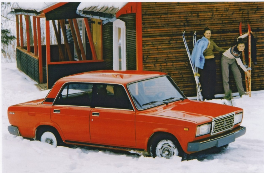
«СЕМЕРКА» СТАЛА ПОСТОЯННЫМ СПУТНИКОМ ЛЮБИТЕЛЕЙ ПУТЕШЕСТВИЙ

Новинка пришлась по вкусу советским автолюбителям: многие стремились приобрести именно «семерку» — она стала олицетворением нового стиля отечественного автопрома. Помимо презентабельной внешности, этот автомобиль обладал еще одним важным, с точки зрения советского человека, качеством: кроме водителя, четырех пассажиров и 80 кг груза, он, как и «пятерка», мог буксировать прицеп массой до 600 кг — это позволяло дачникам без проблем доставлять домой богатый урожай со своих участков.