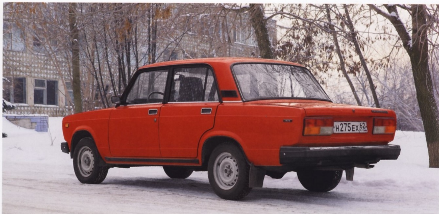
САМАЯ «ЭКОТИЧЕСКАЯ» МОДИФИКАЦИЯ «СЕМЕРКИ» — ВАЗ-21079 С РОТОРНО-ПОРШНЕВЫМ ДВИГАТЕЛЕМ СИСТЕМЫ ВАНКЕЛЯ

Автомобиль ВАЗ-2107 выпускался до 2012 года. За время производства был проведен целый ряд модификаций. Среди ранних стоит отметить ВАЗ-21072, на который устанавливался мотор мощностью 63,5 л. с., и ВАЗ-21072 с двигателем объемом 1,57 л и максимальной мощностью 75,5 л. с. Всего же известно более десятка различных модификаций, в том числе и таких, где вместо карбюратора в системе управления двигателем применялся впрыск топлива.