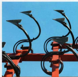
Универсальные стрелчатые лапы культиватора для сплошной обработки почвы. Аэрофотография выставки «Агротехнологии-2013». Ростов-на-Дону.

Бороны предназначены для рыхления поверхностного слоя почвы, выравнивания, разрушения почвенной корки, уничтожения сорняков и т. д. Зубовые бороны обрабатывают почву на глубину от 3 до 10 см. По усилию, которое приходится на один зуб, бороны подразделяют на легкие (5–10 Н), средние (12–15 Н) и тяжелые (16–20 Н). Легкие бороны используют для предпосевного выравнивания поверхности поля, разрушения поверхностной корки, заделки минеральных удобрений и семян. На них ставят зубья круглого сечения. На средние и тяжелые бороны – квадратного сечения. Тяжелые бороны применяют для