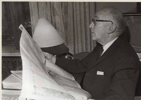
Профессор-экономист Е. Г. Либерман. 1966 г.

Говоря о конкретных проявлениях реформы, обычно приводят пример Щёкинского химического комбината. На всю пятилетку ему был выделен стабильный фонд зарплат