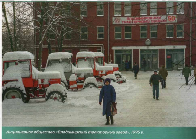
Акционерное общество «Владимирский тракторный завод». 1995 г.

от комплектации. Габаритные размеры: длина – 689 мм, ширина – 628 мм, высота – 865 мм. Двигатель запускается электрическим стартером. На моторе установлен топливный насос марки ЗУТНИ, секционный, рядный с собственным кулачковым валом. Форсунки закрытого типа с многоструйным распылителем. Фильтр грубой очистки топлива со сменным фильтром – патроном. Фильтр тонкой очистки со сменным фильтром. Система смазки комбинированная, от насоса под давлением и разбрызгиванием, с дальнейшим охлаждением