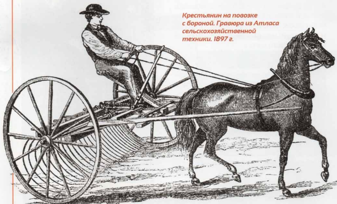
Крестьянин на повозке с бороной. Гравюра из Атласа сельскохозяйственной техники. 1897 г.

В зависимости от особенностей предстоящей операции, можно выбрать специальный вид зубовой бороны. Так, сетчатые бороны (например, БСО-4А) имеют зубья из пружинной проволоки длиной 180–210 мм и диаметром