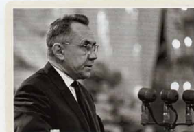
Председатель Совета министров СССР А. Н. Косыгин. 1965 г.

в 1950-е годы профессор Харьковского инженерно-экономического института Е. Г. Либерман создал при нем научно-исследовательскую лабораторию экономики и планирования машиностроительного производства. Коллектив ученых-экономистов начал широкие исследования на предприятиях Харькова и Харьковской области. В 1962 году Либерман направил в ЦК КПСС докладную записку, в которой сформулировал предложения о том, как необходимо реформировать хозяйственный механизм социалистической промышленности. Те же идеи он высказал в статье «План, прибыль, премия» в газете «Правда» от 9 сентября 1962 года. Его предложения поддержали ведущие экономисты В. С. Немчинов, С. Г. Струмилин, эксперты Госплана СССР, руководители предприятий и др. Тему широко обсуждали в прессе и правительстве.