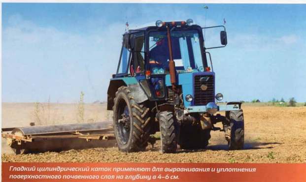
Гладкий цилиндрический каток применяют для выравнивания и уплотнения поверхностного почвенного слоя на глубину 4–6 см.

время работы срезает полосу почвы, а затем поднимает ее на внутреннюю сферическую поверхность, вследствие чего она начинает крошиться, потом частично перемешивается и оборачивается. Увеличение угла атаки дисков приводит к более глубокому погружению дисков в почву, что улучшает ее крошение, а увеличение угла наклона диска к вертикали улучшает перемешивание и оборот почвы. В боронах и лушпильниках диски собраны в батареи – насажены на квадратную ось, чередуясь с распорными катушками (шпильками). В процессе работы ось вращается в подшипниках вместе со шпильками и дисками. Расстояние между соседними дисками регулируют в зависимости от состояния почвы. Глубину хода дисков регулируют с помощью балластных грузов или гидравлических пружинно-нажимных механизмов.