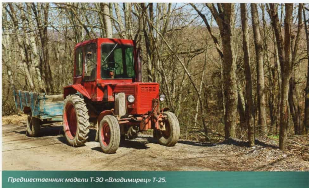
Предшественник модели Т-30 «Владимирец» Т-25.