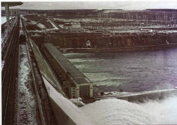
Братская гидроэлектростанция на Ангаре. 1968 г.

Свой вариант реформы выдвинул академик В. М. Глушков. Он предлагал создать Общегосударственную автоматизированную систему учета и обработки информации (ОГАС), которая базировалась бы на единой сети вычислительных центров. Фактически модель предполагала автоматизированное управления всей экономикой СССР в целом. Проект был более затратным. В конечном итоге выбрали вариант Либермана, делавший ставку на человека.