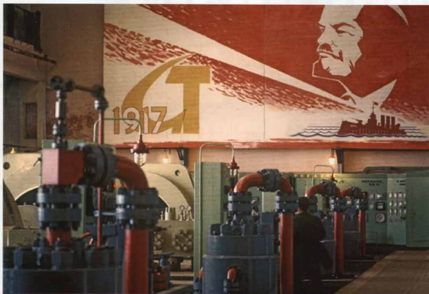
Машинный цех синтеза аммиака и метанола Щёкинского химического комбината. 1970 г.

К осени 1967 года по новой системе работали 5,5 тыс. предприятий (1/3 промышленной продукции, 45 % прибыли), к апреля 1969-го – 32 тыс. предприятий (77 % продукции). Повысилась скорость обращения в фазе «товар – деньги», процесс поставок и расчетов стал более ритмичным, основные фонды использовались более рационально. Предприятия разрабатывали выгодные системы поощрения.