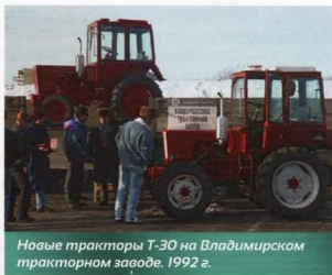
Новые тракторы Т-30 на Владимирском тракторном заводе. 1992 г.

Рулевая колонка включает в себя рулевое колесо и насос-дозатор. Вал дозатора вращается синхронно с рулевым валом и обеспечивает подачу в гидроцилиндр масла в количестве, пропорциональном углу поворота рулевого колеса. При заглушенном двигателе и вращении рулевого колеса дозатор работает как насос, перекачивая масло в соответствующие полости силового гидроцилиндра, а в насос-дозатор масло подает гидравлический аккумулятор, который состоит из корпуса, крышки, цилиндра, поршня и пружины, расположенных в баке.