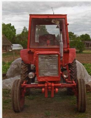
Компактный и маневренный, Т-30 был удобен для небольших хозяйств.

Диаметр поршня составляет 105 мм, ход – 120 мм. Рабочий объем силового агрегата – 2,08 л. Номинальный коэффициент запаса крутящего момента составляет около 15 %. Расход топлива при рабочей нагрузке на двигатель – 245 г/кВт. Сравнительный расход масла на угар от расхода топлива обладает диапазоном значений от 0,3 до 0,5 %. Масса в сухом состоянии – 272–295 кг, в зависимости