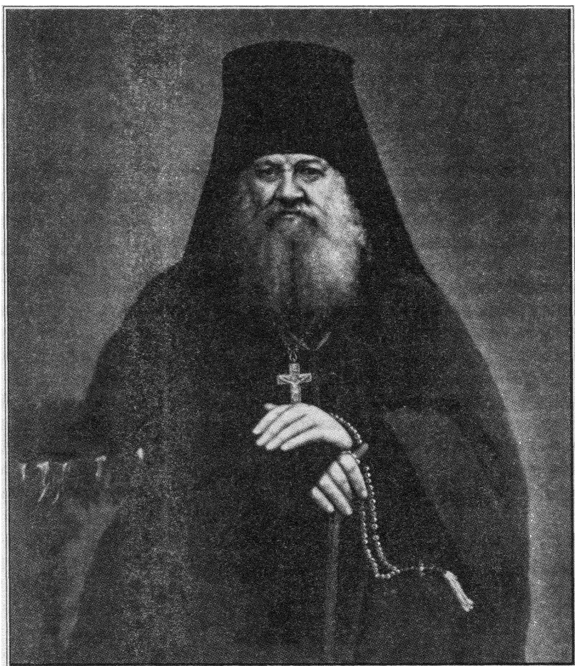
Игумен Антоний (Алексей Поликарпович Бочков) 1803–1872