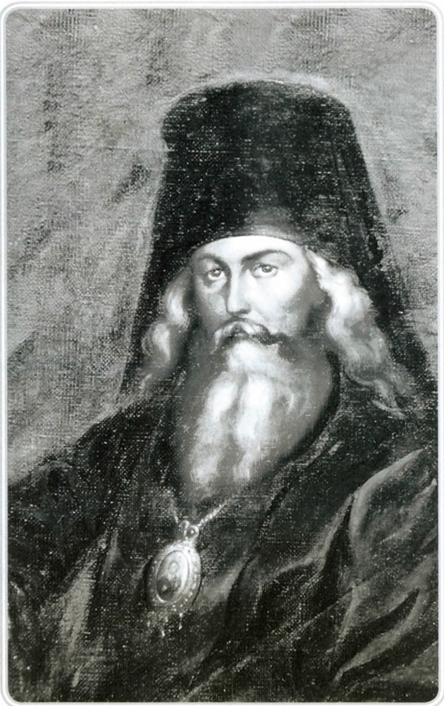
Святитель Игнатий (Брянчанинов)