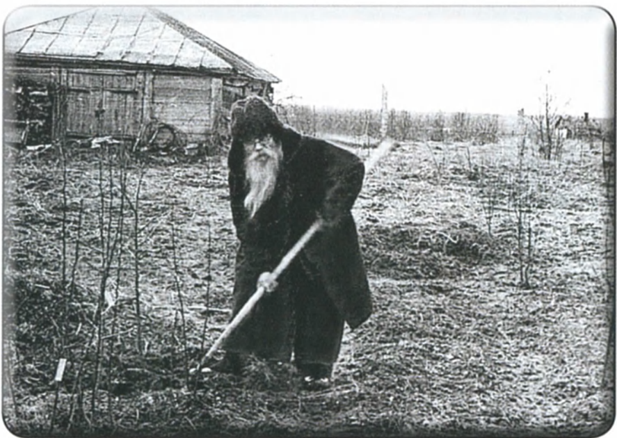
Игумен Никон (Воробьев)